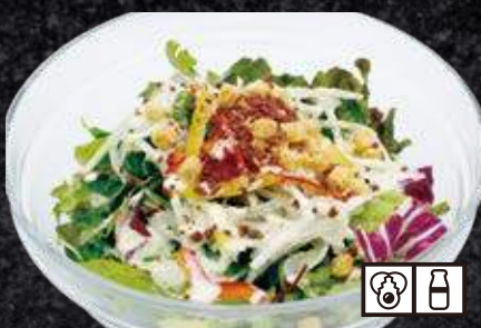
シーザーサラダ 680円 (税込 748円)