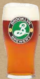
ブルックリン ラガー