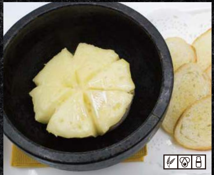
焼カマンベール 1,300円 (税込 1,430円)