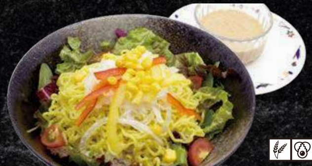
冷やしごまだれラーメン 980円 (税込 1,078円)