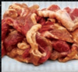
味付きラム肉ジンギスカン