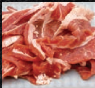
定番ラム肉ジンギスカン