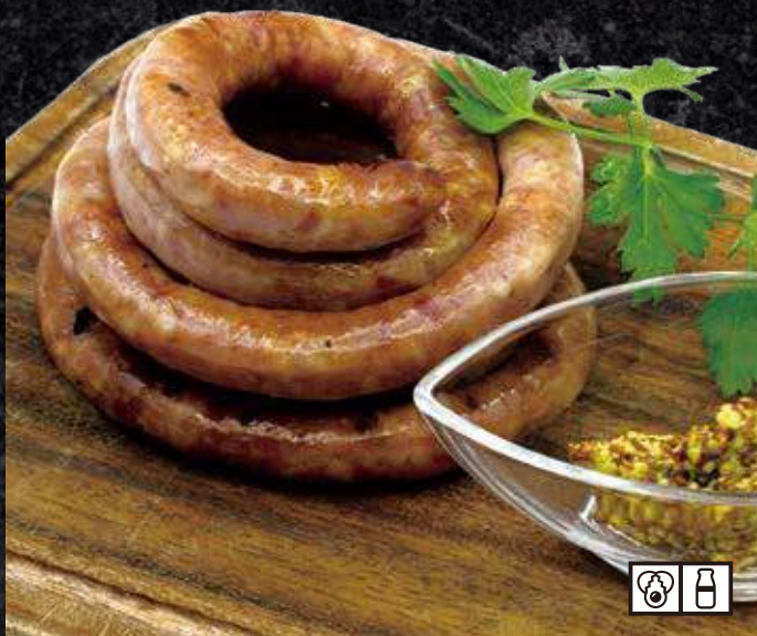
グルグルソーセージ 1,480円 (税込 1,628円)