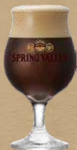
SPRING VALLEY Afterdark

希少な日本産ホップ 「MURAKAMI SEVEN」を 使用。上質感のあるIPA。