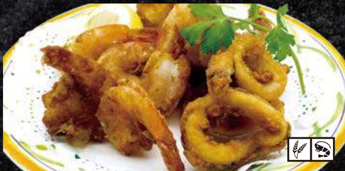
ガーリックシュリンプとイカの唐揚げ 650円 (税込 715円)