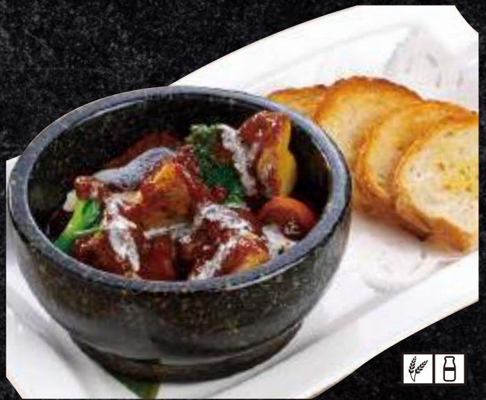
牛肉の黒ビール煮 1,490円 (税込 1,639円)