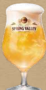
SPRING VALLEY シルクエール<白>