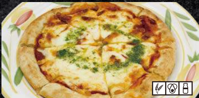
マルゲリータ・ピザ 1,190円 (税込 1,309円)