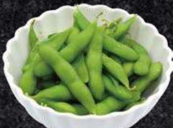
中札内産塩ゆで枝豆 300円 (税込 330円)