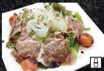
生ハムサラダ 840円 (税込 924円)