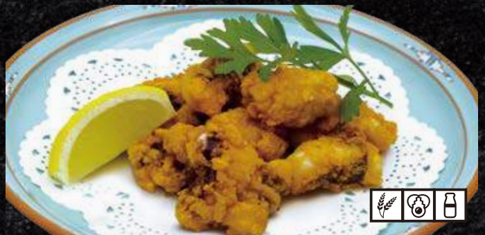
タコの唐揚げ 790円 (税込 869円)