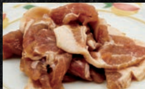
豚肩ロースジンギスカン