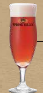
SPRING VALLEY JAZZBERRY