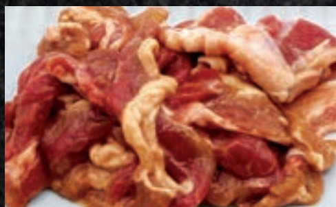
味付きラム肉ジンギスカン