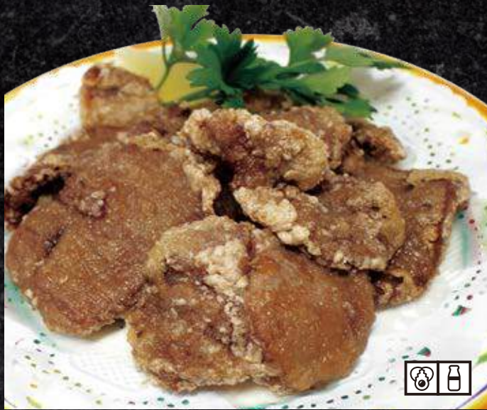
ジンギスカンザンギ 690円 (税込 759円)