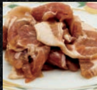
豚肩ロースジンギスカン