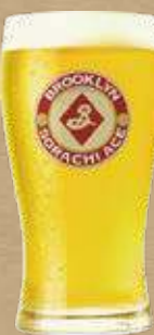
ブルックリン ソラチエース