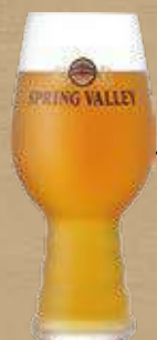
SPRING VALLEY MURAKAMI SEVEN IPA