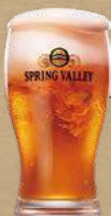
SPRING VALLEY 豊潤<496>