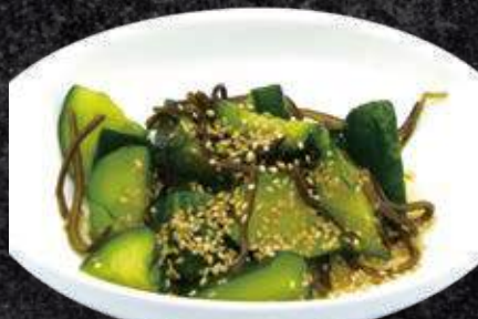
たたき胡瓜の塩昆布和え 400円 (税込 440円)