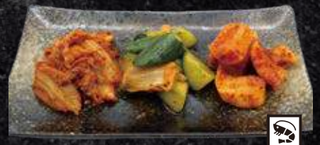
キムチ三種盛り 500円 (税込 550円)