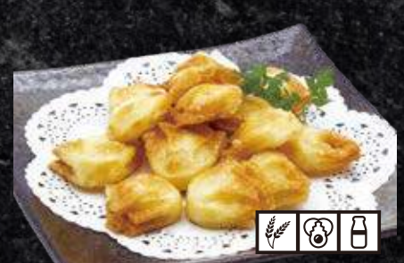
ひとくちチーズ揚げ 550円 (税込 605円)