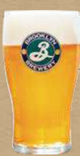
ブルックリン ディフェンダーIPA