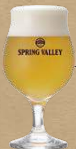
SPRING VALLEY Daydream